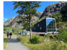
Jøssingfjord vitensenter